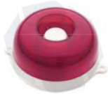
МАЯК-12-КП, МАЯК-24-КП оповещатель комбинированный