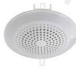
АРИЯ-10 П оповещатель речевой 3Вт/5Вт/10Вт